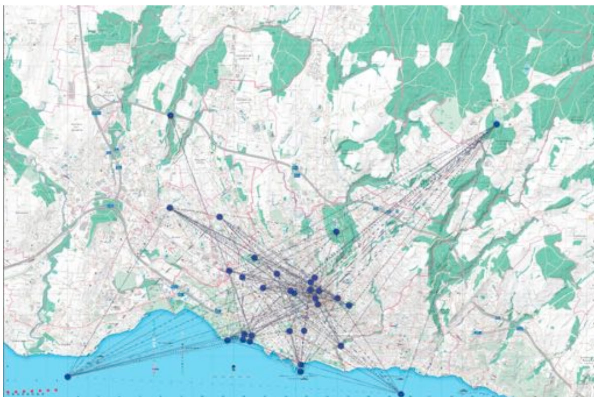
Carte interactive du projet / Détail.

Théorie du Drone, Grégoire Chamayou, 2013